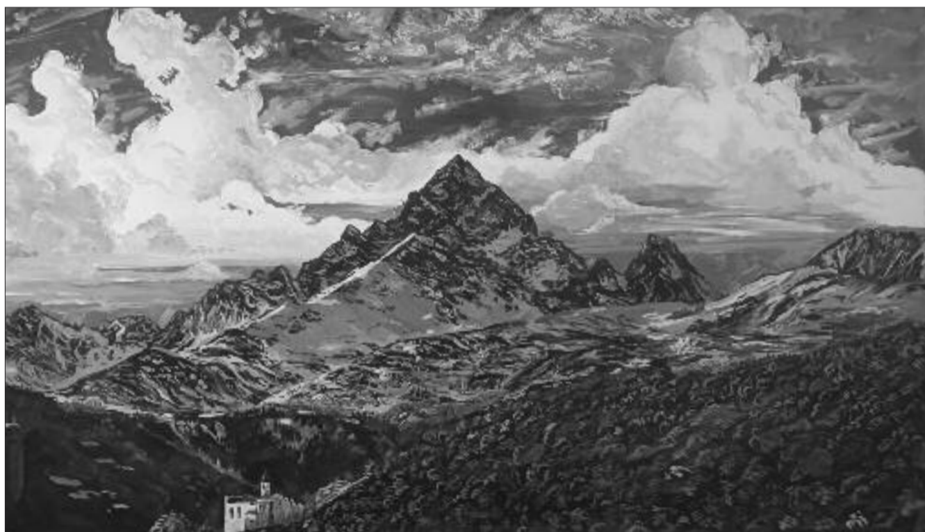
Il Monviso a primavera