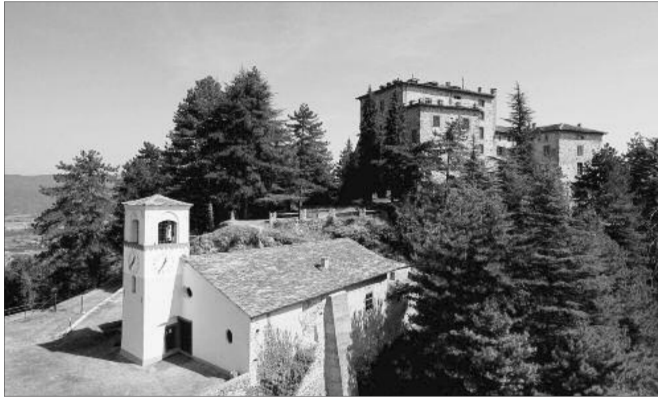
Vista della chiesa e del castello di Montemale

Ritenendo piuttosto improbabile che nei prossimi giorni le montagne si ricoprono di abbondante neve, per ora propongo una passeggiata sul versante al sole di Montemale, in una zona molto panoramica e piuttosto calda, dove si possono percorrere dei comodi sentieri adatti anche a famiglie con bambini. Un breve percorso raggiunge il bric delle Forche che si trova alla stessa quota di Montemale ed è come un balcone proteso verso la bassa valle Grana, non particolarmente notevole di per sé, ma gradevole e interessante per il tragitto che si effettua per raggiungerlo. Eccettuato l'ultimo breve tratto sotto il castello, l'eventuale neve caduta si scioglie in brevissimo tempo. Descrivere anche, per chi voglia allun-