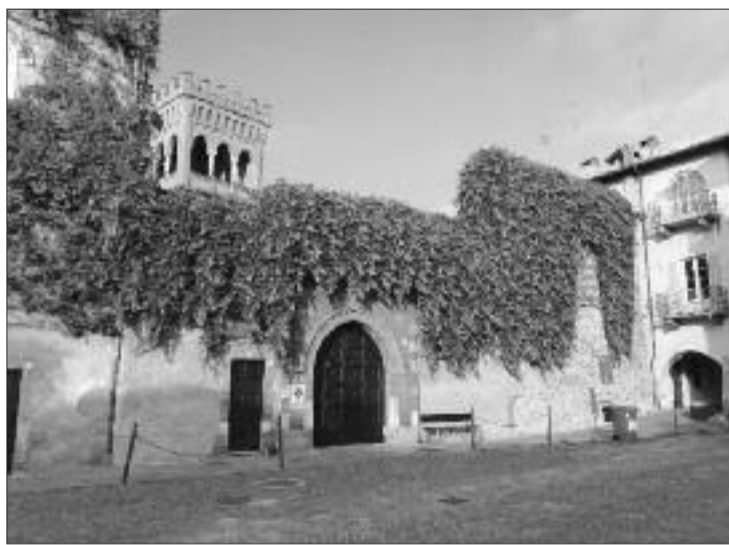
Un palazzo signorile a Dronero

Nell'ultimo consiglio comunale di fine anno il Sindaco Astesano ha confermato quanto già anticipato a fine novembre, nel 2025 l'IMU aumenterà. L'aliquota passerà dall' 1% al 1,06%, questo comporterà un aumento degli importi da un minimo di 30 euro a un massimo di 50-60 euro circa, questo in funzione della tipologia di abitazione. L'introito per il comune passerà da 1 mln e 261mila euro a 1 mln e 420 mila euro, con un incremento di circa 140mila euro. Questo aumento, ma soprattutto le motivazioni che lo giustificano, inducono a qualche considerazione. Partiamo dal primo dato certo, o quasi, la finanziaria 2024 ha previsto un taglio dei trasferimenti di 40mila euro, la finanziaria 2025, in votazione a fine anno, prevede un ulteriore taglio, più o meno della stessa entità, quindi nel 2025 al bilancio del comune mancheranno 80-90 mila euro. Passiamo a due altri dati che certi non sono, ma quasi, si tratta di due voci di spesa che sono state portate nel bilancio preventivo allo stesso valore del 2024, si tratta del trasporto alunni che presenta un costo di 137mila euro a fronte del quale il comune, con le rette, riesce a recuperare circa