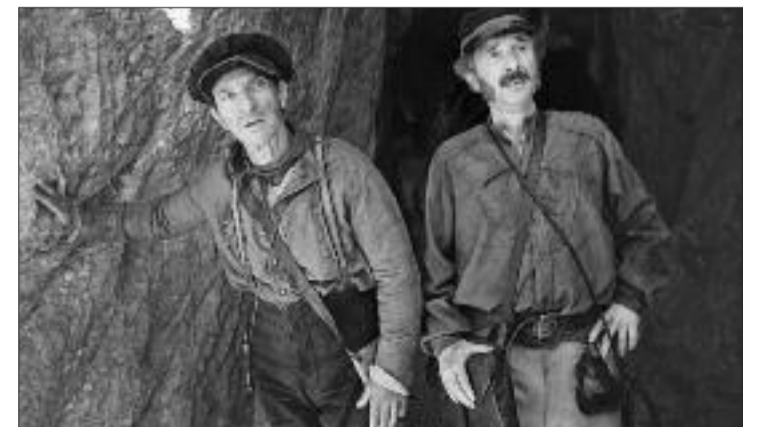
"L'abbaglio" di Roberto Andò con Salvatore Ficarra e Valentino Picone

Infine, venerdì 28 il mese si chiuderà con un appuntamento teatrale rappresentato da " Ti aspetto in finale " di e con Boris Mosca e prodotto da ASD Tela di Alba. Lo spettacolo si snoda sotto forma di ricordi, sensazioni e vicende che attraversano il tempo. Un monologo interiore, un crocevia di stagioni che si rincorrono attraverso momenti giocosi e fiabeschi. Il tutto narrato con umorismo e divertimento, con nelle narici l'odore infinitamente magico della montagna, memoria del tempo e dell'orgogliosa identità della Valle Maira. L'1 e 2 marzo sarà possibile partecipare a un laboratorio di improvvisazione con Boris Mosca. Info e prenotazioni: cineteatroiris.ops@gmail.com