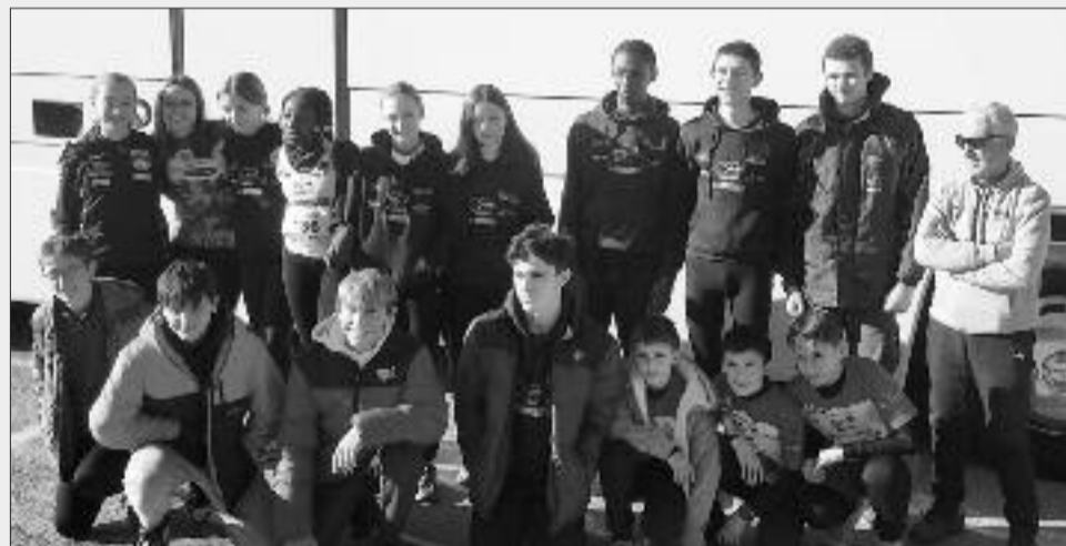
I giovani atleti della Dragonero a Beinette

L'anno è iniziato con le campestri, seguiranno le gare di velocità al campo di atletica e poi le gare di corsa in montagna e su strada. Il 22 Febbraio si svolgerà a Dronero il "Cross del Bersaglio" gara di corsa campestre ampiamente collaudata che negli anni passati ha riscosso un buon successo sia per il numero che per il livello dei partecipanti. È aperta a tutte le categorie di età. SS