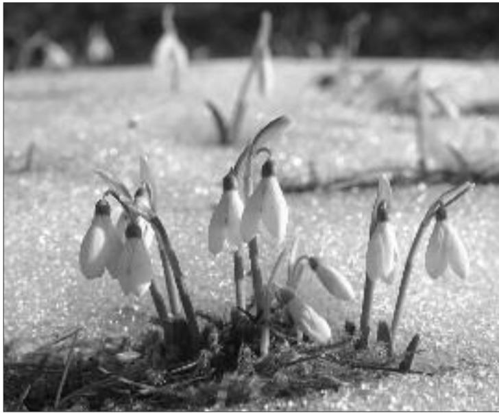
Fioritura di bucaneeve a fine inverno

Anche detto Galantino e Foraneve , il Bucaneve rappresenta la speranza e la tenacia manifestate nel persistere della sua vita vegetativa nonostante la stagione avversa, perciò anche simbolo della consolazione come narra la leggenda che lo vorrebbe creato da un angelo pietoso per riportare sorriso e luce alla disperata Eva cacciata con Adamo dal Paradiso terrestre.