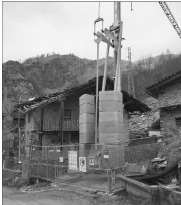
Nelle foto, alcuni dei cantieri avviati ad Elva