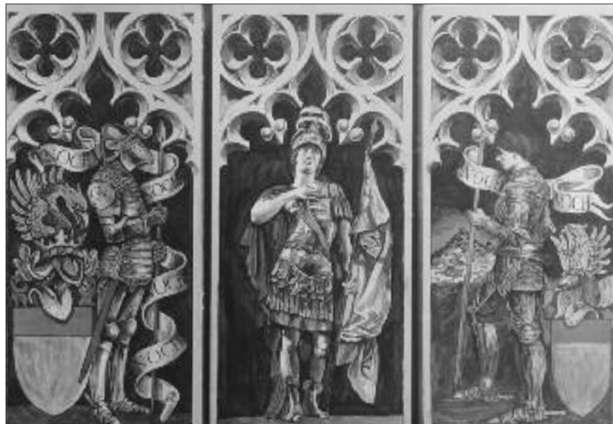
Trittico dei Marchesi di Saluzzo

Un'esposizione "leonardesca" per qualità, quantità e varietà delle opere esposte: le sale sono letteralmente rivestite di ritratti che paiono del XV secolo, cofani dipinti, grandi vedute del "Re di Pietra", enormi e raffinati stendardi eseguiti a olio su damasco, stemmi araldici rievocanti le glorie del Marchesato di Saluzzo e ancora decine di taccuini di viaggio ricoperti da volti, paesaggi, schizzi. La tematica che contraddistingue la mostra è il perduto mondo cavalleresco del saluzzese e del Vecchio Piemonte e le arti figurative in grado di esprimerlo con vibranti colori che permeavano la vita e la cultura dell'epoca. Un mondo descritto da Victor Hugo con queste parole "La prima metà del Medioevo è scritta nel simbolismo delle chiese romaniche, la seconda negli stemmi araldici. Sono i geroglifici del feudalesimo dopo quelli della teocrazia". Un vero e proprio giacimento d'arte dai significati ben specifici e tuttora semiconosciuto proviene dai pennelli di una singolare figura di pittore e viaggiatore - Gabriele Reina - già allievo di un maestro futurista, in-