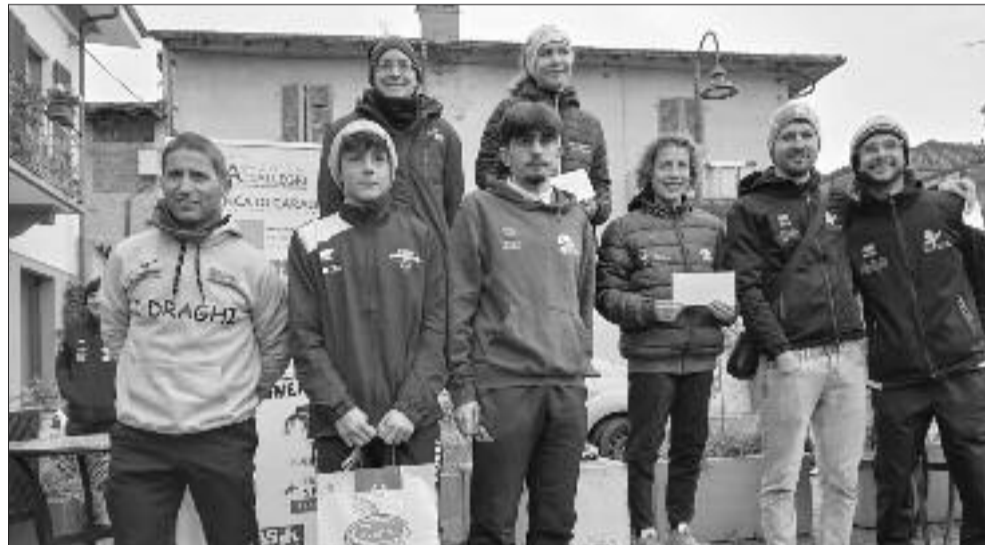
Uno dei podi di categoria in piazza Scaglione