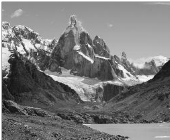
Veduta del Cerro Torre