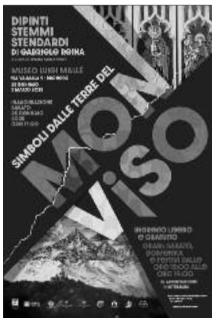
Manifesto della mostra

La mostra "Simboli dalle Terre del Monviso", è visitabile al Museo Mallé dal 25 gennaio al 2 marzo 2025, sabato e domenica ore 15-19.