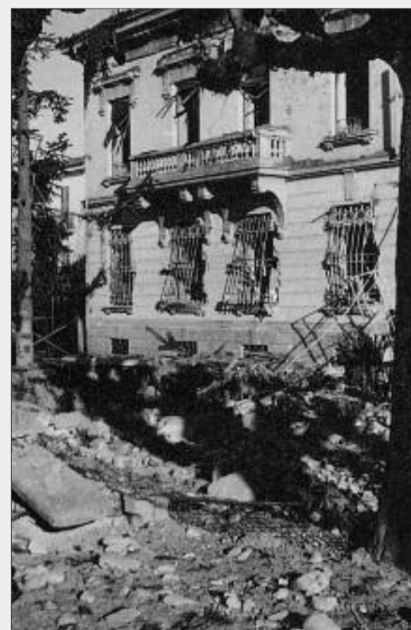
Nelle foto "villa Foglia" semidistrutta