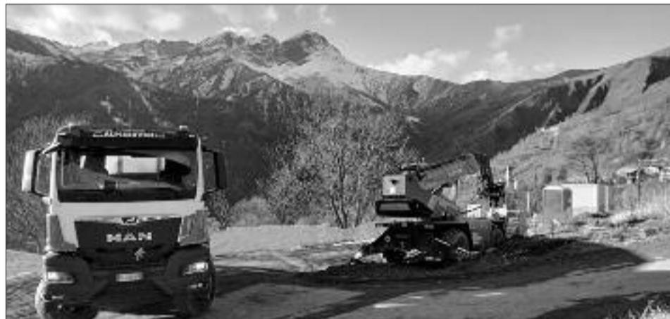
Cantieri ad Elva

inviato al presidente Cioffi la richiesta di rinviare nuovamente il Consiglio facendolo precedere da una convocazione urgente dell'Assemblea dei Sindaci. "Tale richiesta - si legge - è motivata dalla necessità di tentare un'intesa, la più ampia possibile, fra i Sindaci e le parti interessate questo al fine di mettere il Consiglio in condizione di lavorare con la necessaria serenità"