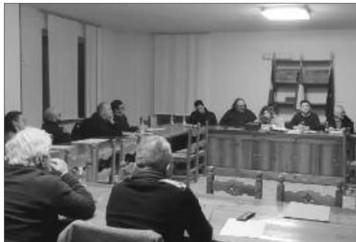
Un momento della seduta consiliare

annuale delle partecipazioni dell'Unione montana. L'ente detiene l'11,96% dell'Azienda di Formazione Professionale AFP di Dronero, il 18% di Maira Spa, ancora l'11,96 del Gruppo di Azione locale (GAL) e infine una piccola quota in Fingrando, società ormai da tempo in liquidazione. Il dibattito, in particolare si è focalizzato proprio su Maira Spa che - come abbiamo già detto il mese scorso - è controllato all'82% dal colosso energetico Iren e sulle prospettive che potrebbero aprirsi nella revisione delle concessioni da qui al 2030. Insomma una partita davvero importante per il futuro economico della Valle di fronte alla quale - e su questo c'è unanimità di intenti - bisogna essere preparati e protagonisti. Il punto è stato approvato con una sola astensione.