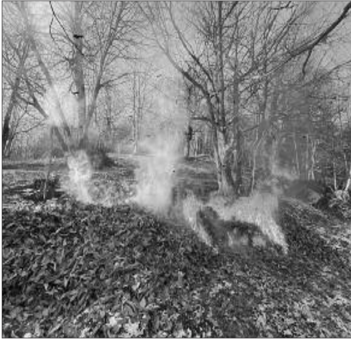
Bruciare materiale vegetale non si può

Nel dibattito si parla anche di Tari che subirà lievi ritocchi in funzione delle tariffe applicate per il servizio. Il comune spende circa 170mila euro all'anno che devono essere coperti dall'utenza. Il bilancio di previsione viene approvato a maggioranza, con l'astensione dei rappresentanti di opposizione. Esaminato anche l'elenco delle società o istituzioni partecipate dal comune in particolare ACDA per l'acqua e il servizio fognatura, l'ACSR e il CEC per il servizio raccolta e smaltimento