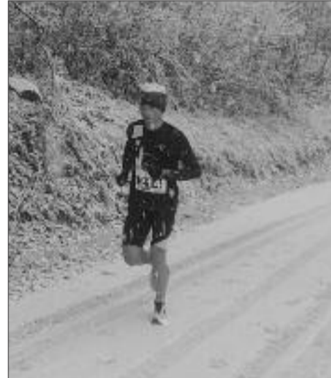
Un partecipante sotto la neve