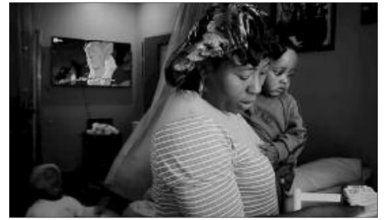
"Mama Mercy" di Alessandra Cutolo

Fra gatti coraggiosi e storie della valle